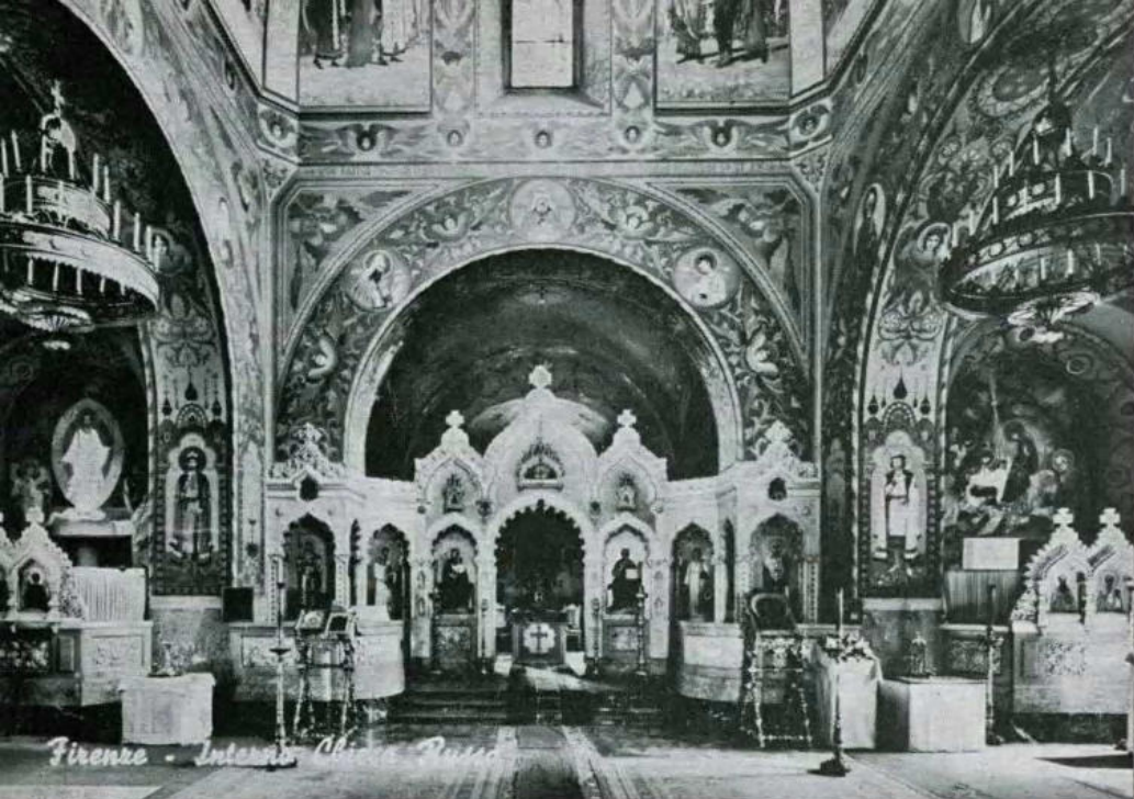
Interno della chiesa ortodossa russa di Firenze

Dal 1917 al 1923, a causa della rivoluzione sovietica, erano venuti a riversarsi in America oltre mezzo milione di rifugiati russi, per i quali era necessario provvedere un'assistenza religiosa adeguata. In un primo momento chi s'incaricò dell'organizzazione ecclesiastica di questa numerosa massa di ortodossi russi fu la Chiesa russa in esilio, che nel 1920 aveva posto la sua sede a Karlovei in Jugoslavia. A causa però dei dissensi scoppiati fra questa Chiesa ed il patriarca Tichon, questi nominò il metropolita Platone a capo della metropoli ortodossa russa dell'America del Nord, con l'incarico di organizzare la gerarchia.