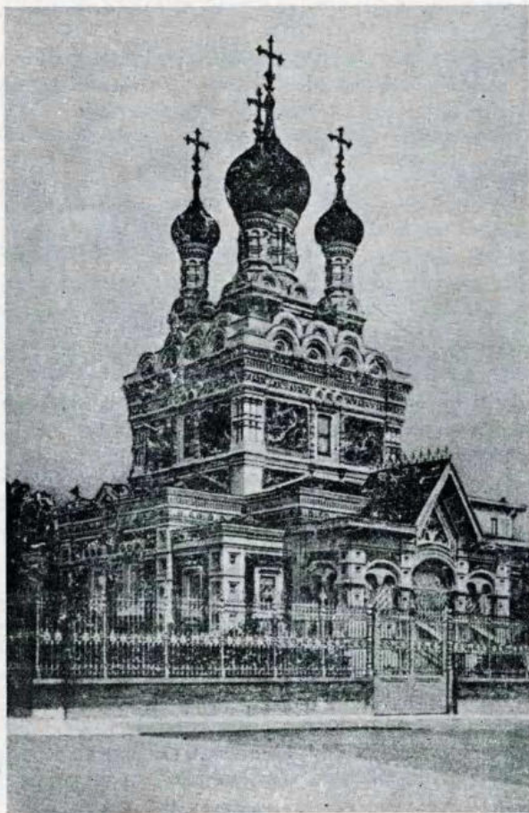
Chiesa ortodossa russa di Firenze. Esterno

Nel 1917, in seguito alla proclamazione dell'indipendenza politica dell'Ucraina, la gerarchia ortodossa della nuova repubblica istituì un Consiglio ecclesiastico panucraino e la maggioranza di esso si pronunciò per l'indipendenza della Chiesa ucraina. Il 1° gennaio 1919 tale decisione venne ratificata dal Consiglio Nazionale o Rada della nuova