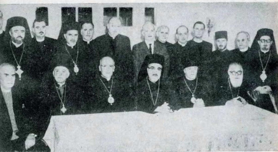
Gerarchia ortodossa d'America riunita a Boston (24-1-1962)

Chiesa e il Patriarcato ecumenico di Costantinopoli. Ecco perchè questa Chiesa russa in esilio non è in rapporto con nessuna Chiesa ortodossa, nè è da alcuna di esse riconosciuta.