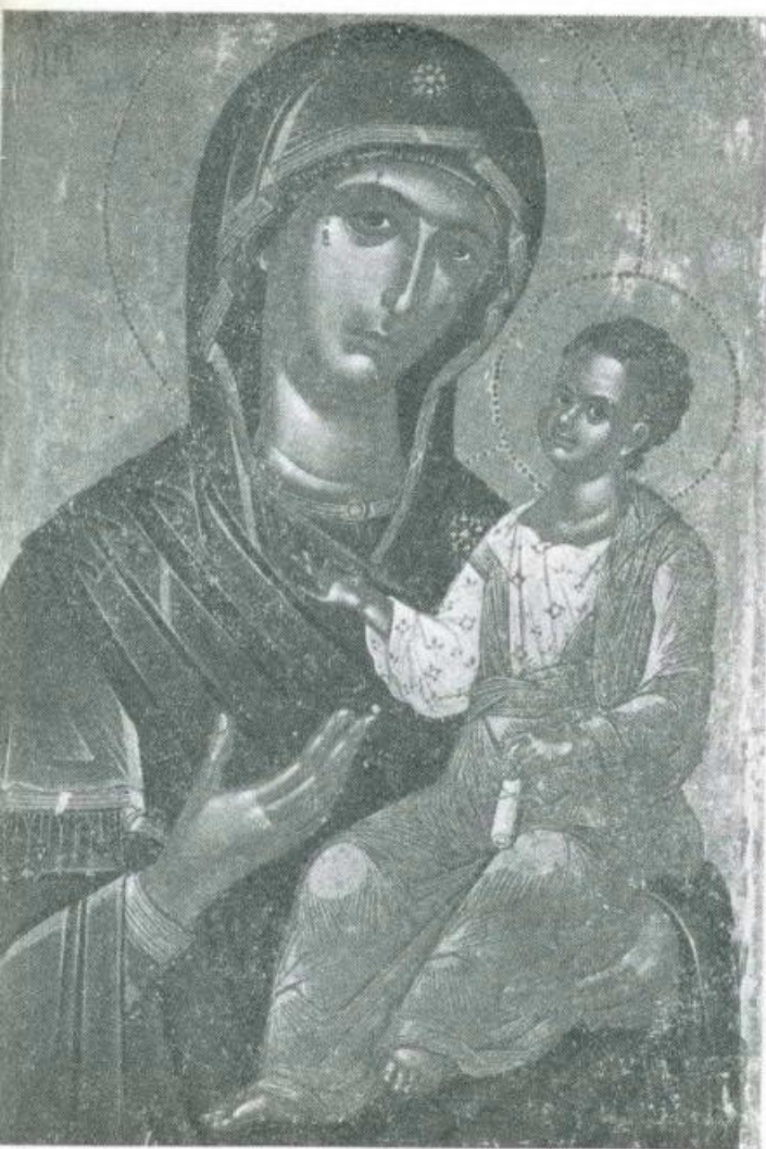
ODIGITRIA. Variante « Vrefokratusa » di Teofane di Creta (1546), conservata nel monastero di Stavronikita del Monte Athos.