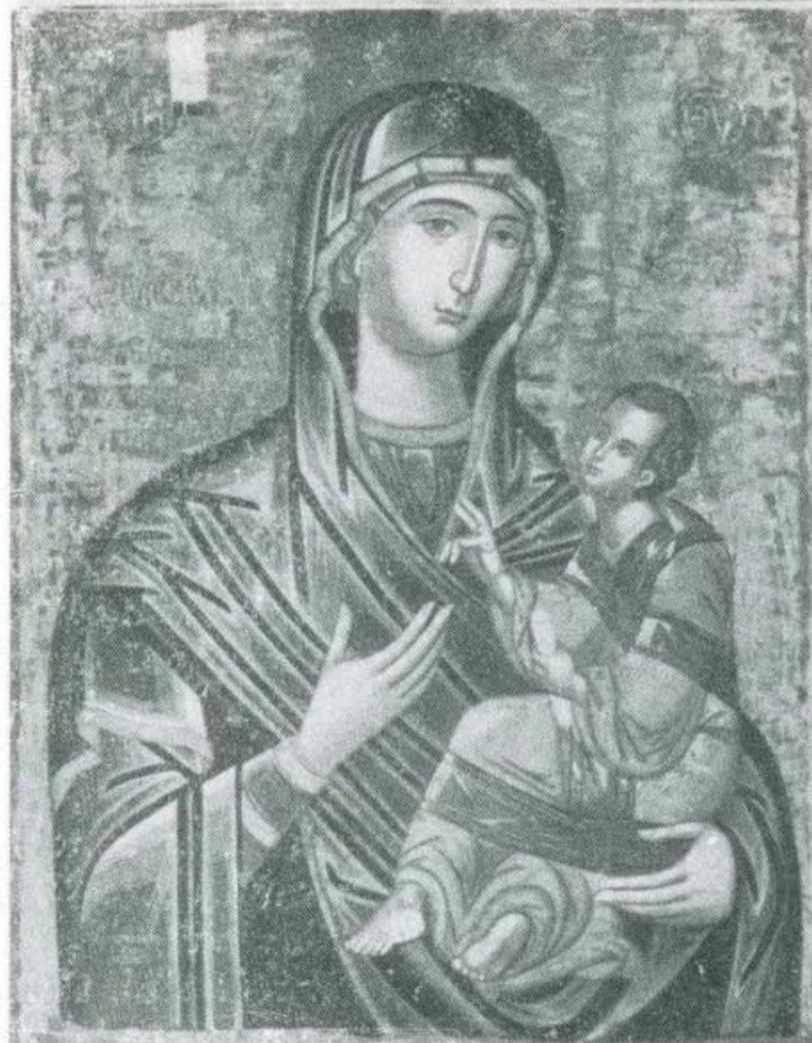
ODIGITRIA. Variante « Eleusa ». Sec. 17 o , a firma di Ioannikios, monaco pittore cretese del monastero greco di Mezzojuso. Oggi la tavola (cm. 115 x 85) appartiene al patrimonio iconografico della Eparchia di Piana degli Albanesi