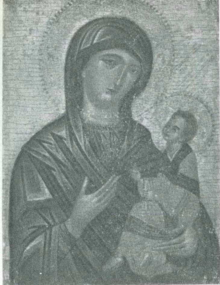
ODIGITRIA. Variante « Eleusa ». Sec. 15 o Scuola italo-bizantina