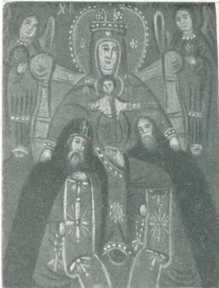
ODIGITRIA. Variante. Scuola balcanica. Sec. 18 o La Madre di Dio col Bambino è in trono, attorniata da due angeli e sorretta da due calogeri, vestiti col tipico « megaloschima »