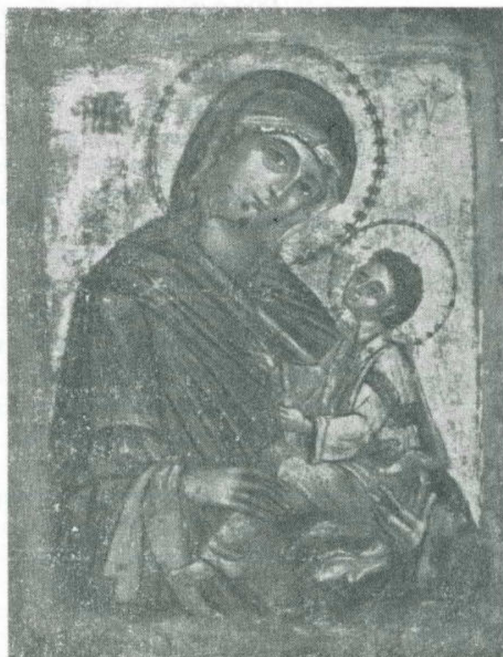
ODIGITRIA. Scuola greca. Sec. 17 o