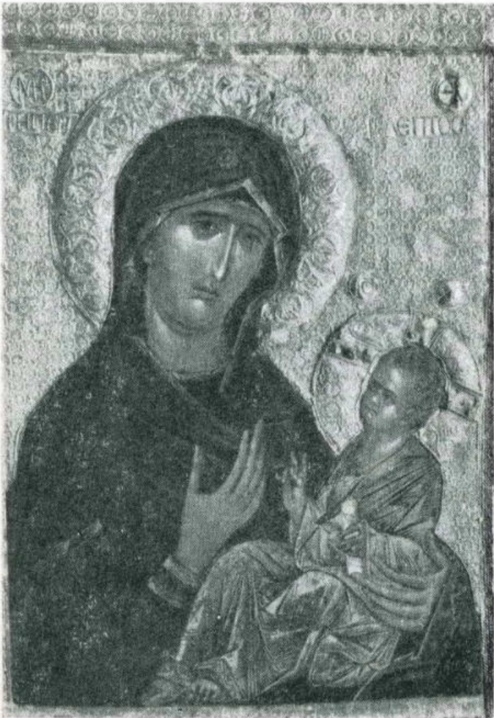
Museo Naz. di Ohrid. ODIGITRIA. Variante « Perivleptos » Sec. 14°