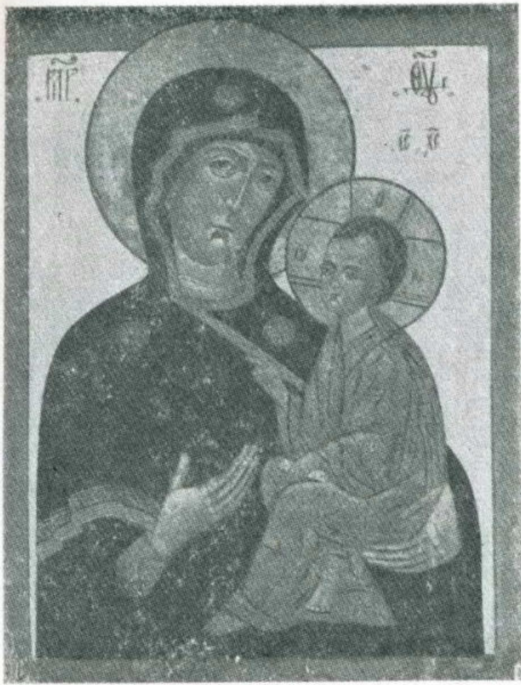
ODIGITRIA. Variante « Eleusa ». Scuola russa. Sec. 17°