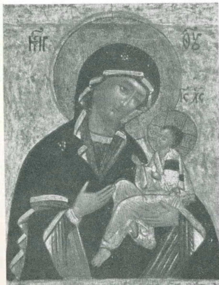
ODIGITRIA. Variante « Grusinskaja ». Scuola russa. Sec. 18 o