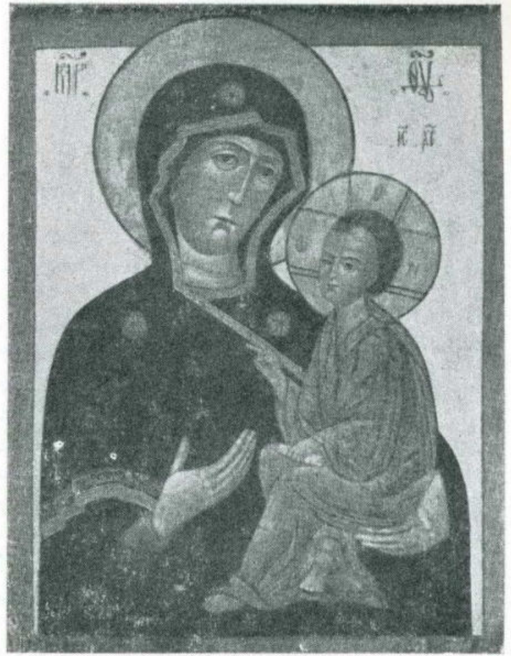
ODIGITRIA. Scuola russa. Sec. 17°