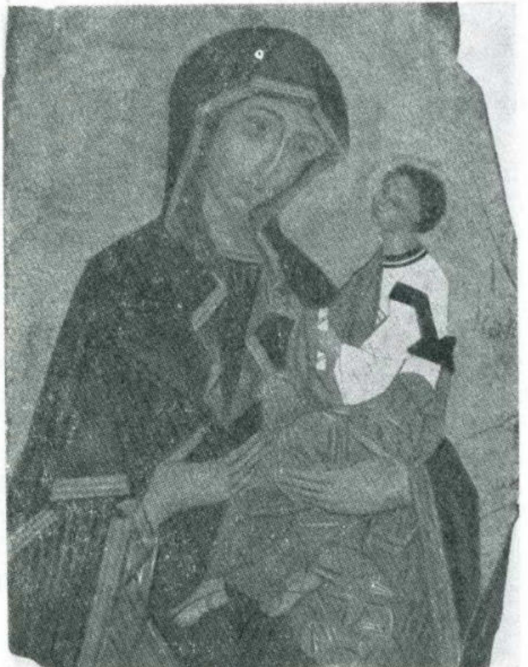
ODIGITRIA. Variante « Eleusa », Sec. 16° Scuola balcanica