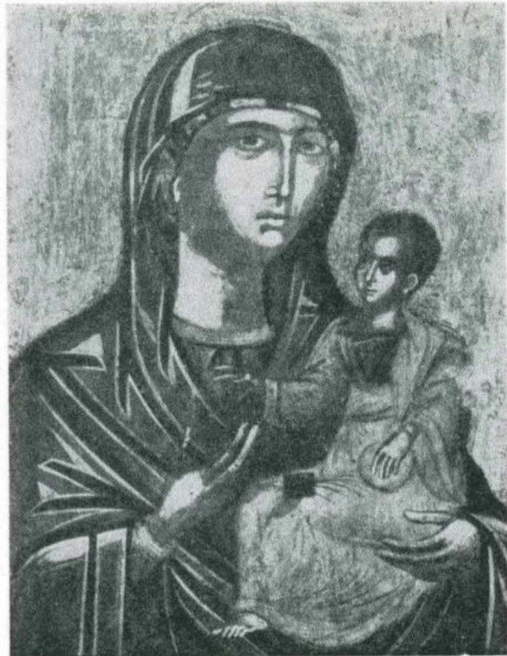
ODIGITRIA. Scuola albanese. Sec. 17° Oggi patrimonio dell'Eparchia di Piana degli Albanesi