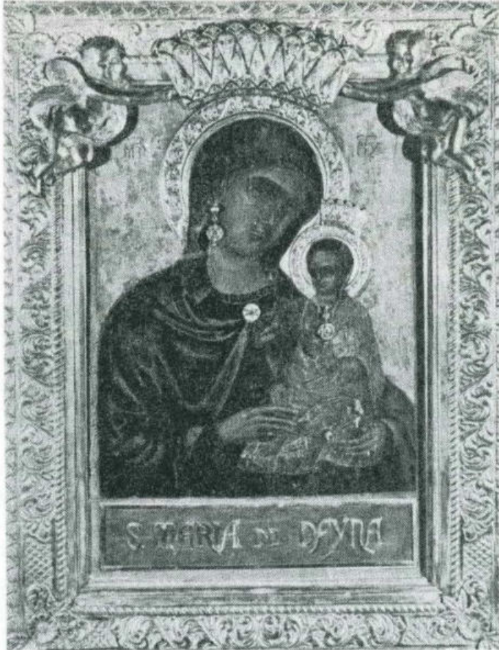
ODIGITRIA. Scuola dalmata. L'icona, forse un tempo appartenuta a famiglie di Piana degli Albanesi, il cui territorio confina con quello di Marineo, è oggi venerata nel santuario dei Frati Minori Conventuali di Marineo (Palermo), col titolo di «Madonna della Dayna»

L'usanza della Chiesa latina di dedicare il sabato alla Madonna forse ha qualche relazione con la venerazione dell'icona costantinopoliana. Alcuni autori latini medioevali ci informano che un'immagine della Vergine in Costantinopoli miracolosamente alzava il proprio velo ogni sabato, indicando così il desiderio che tale giorno doveva essere a lei dedicato. Forse si trattava dell' Odigitria , giacché tale leggenda, ambientata in Costantinopoli, non avrebbe goduto il favore dei Latini, salvo che ciò avvenne durante il periodo della loro occupazione. Inoltre, la leggenda non avrebbe potuto originare fra i Greci in quanto essi non hanno mai dedicato il sabato alla Theotókos . Bisogna pure ricordare che l'usanza di dedicare il sabato alla Madre di Dio esisteva in Occidente molto prima della capitolazione di Costantinopoli, per cui una tale leggenda avrebbe favorito l'uso, e addotto a suo favore.