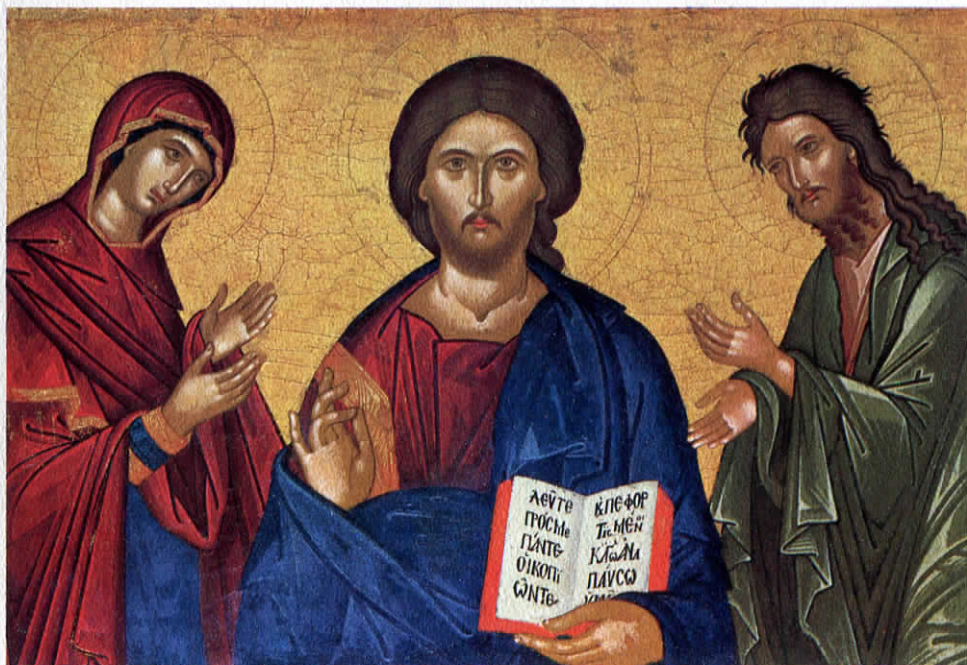
Deisis. Cretese. Tardo '600

L'Eparchia di Piana offre con queste sue iconi tutta la propria tradizione che la collega al mondo bizantino ed albanese, alla venuta e alla presenza dei suoi figli in Sicilia, e ricollega se stessa e la Sicilia al mondo orientale di ieri e di oggi con convinzione di fraternità mai sopita ed efficacia di unità sempre auspicata.