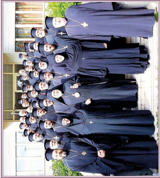
ΙΑ' Τερατική Σύναξις (Ρώμη 2018).