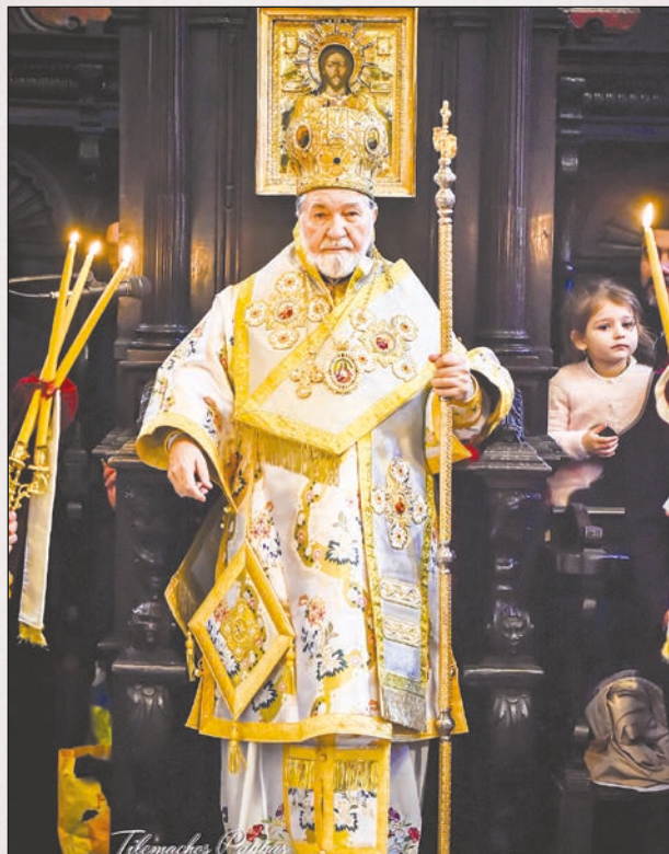
Ὁ Σεβασμιώτατος Μητροπολίτης Ἰταλίας καὶ Μελίτης καὶ Ἐξάρχος Νοτίου Εὐρώπης κ. κ. Γεννάδιος.