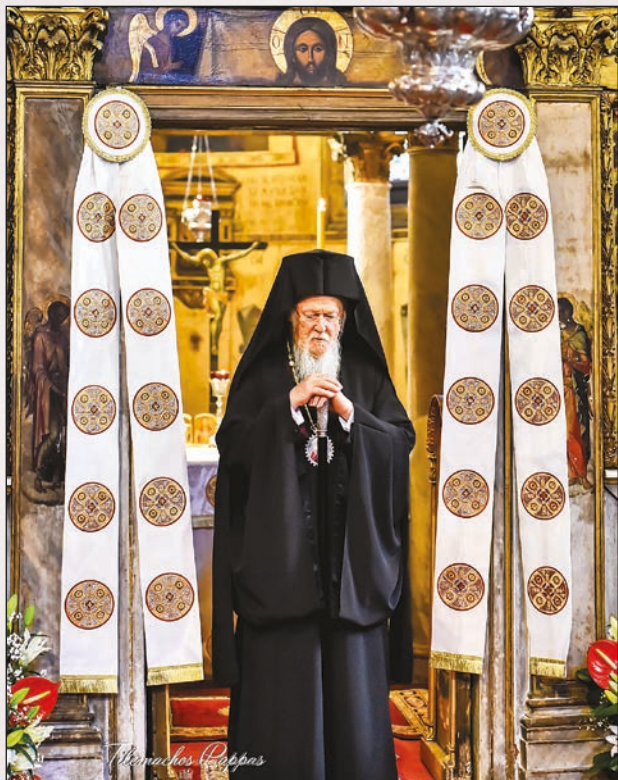
Ἡ Αὐτοῦ Θειοτάτη Παναγιότης ὁ Οἰκουμενικὸς Πατριάρχης κ. κ. Βαρθολομαῖος.