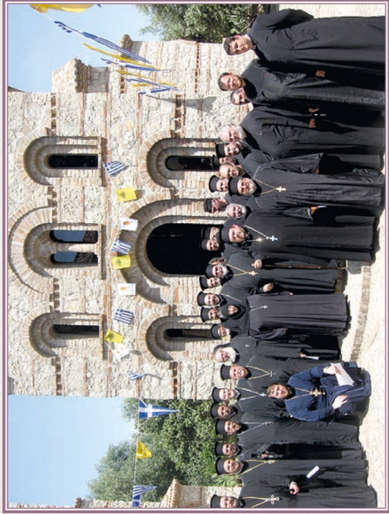
Β' Τερατική Σύναξις (Σεμνάρα 2009).