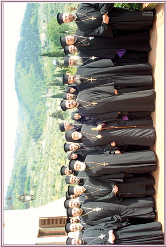
Γ' Ιερατική Σύναξις (Φλωρεντία 2010).