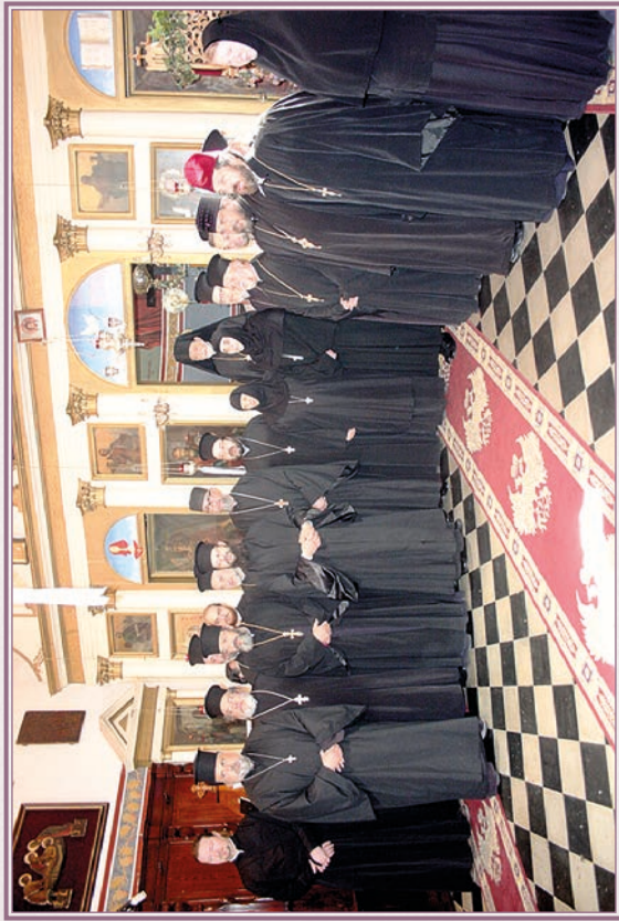
Η' Γερατική Σύναξις (Βρινδήσιον 2015).