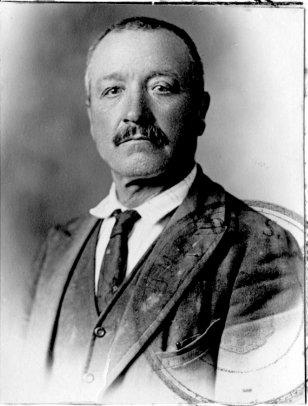
FIRMA DEL TITOLARE

Testa: alta. Capelli: neri. Occhi: azzurri. Naso: aquilino. Bocca: labbra carnose. Denti: sani. Pelle: chiara. Statura: media. Voci: forti.