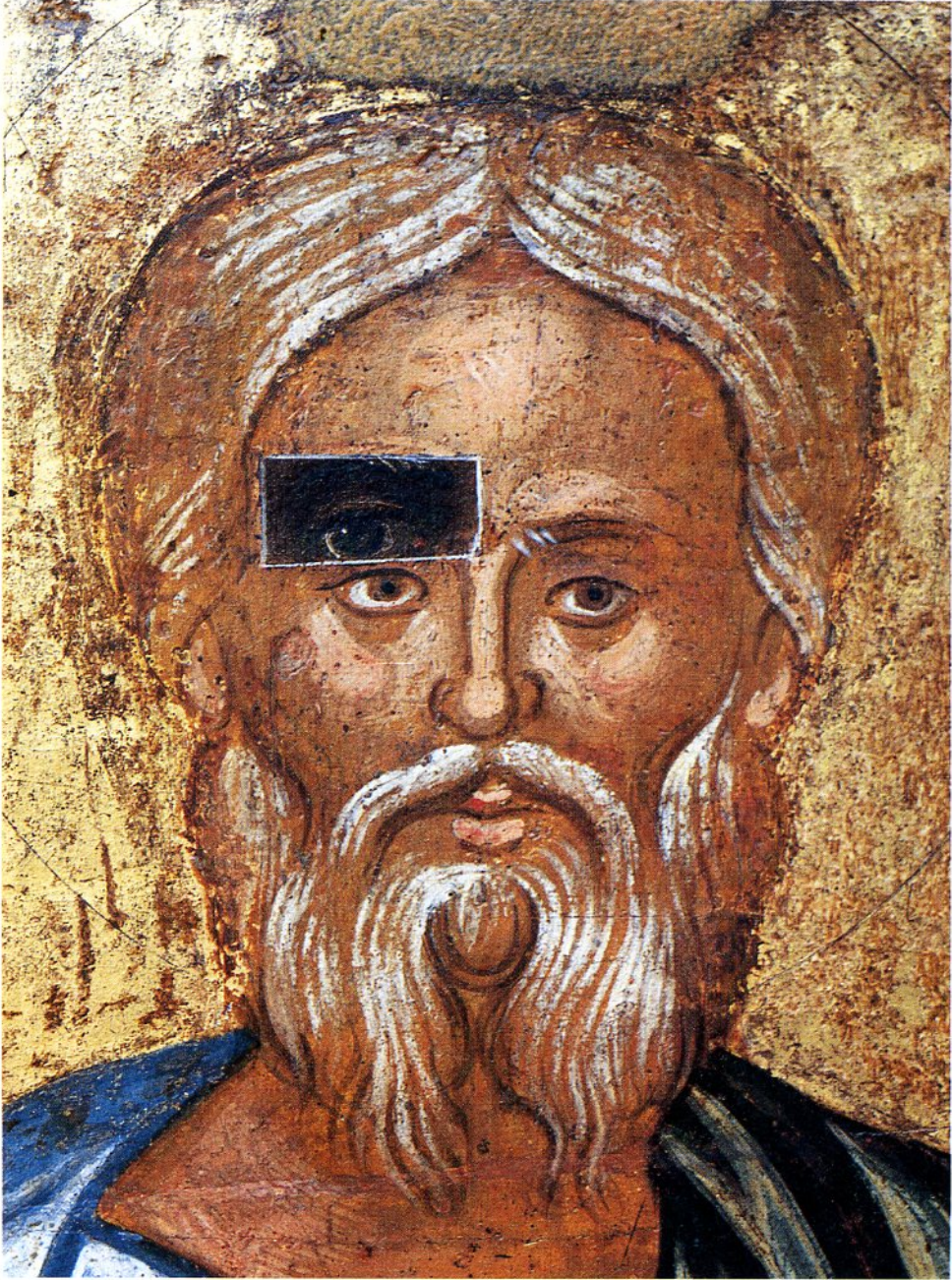
Icona di Sant'Andrea.