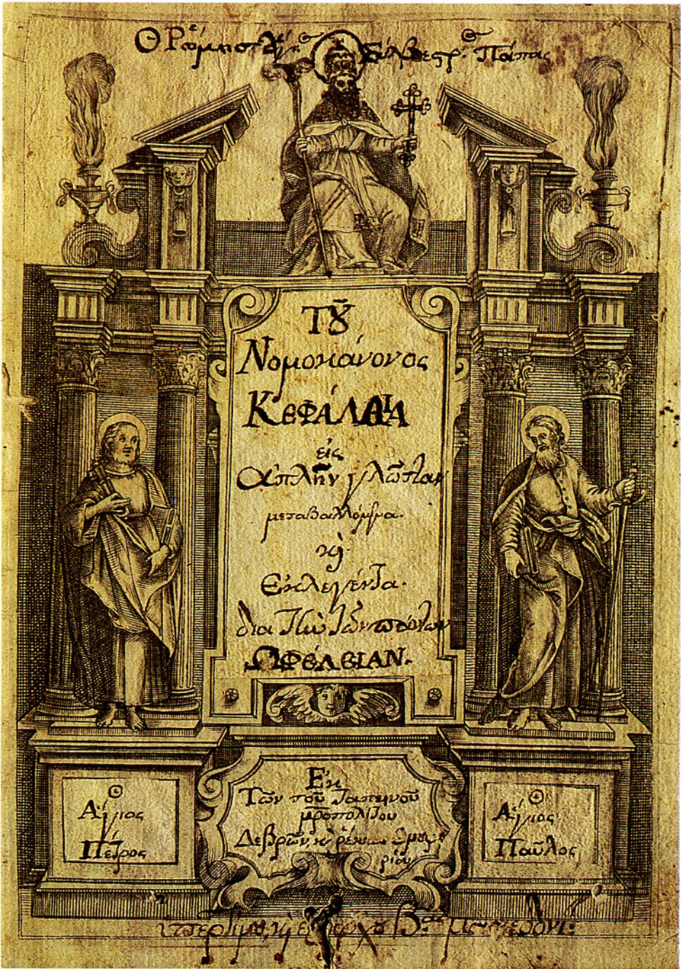
Nomocanon [Elenco di norme civili e religiose per i cristiani] (ms. gr.) sec. XVII.