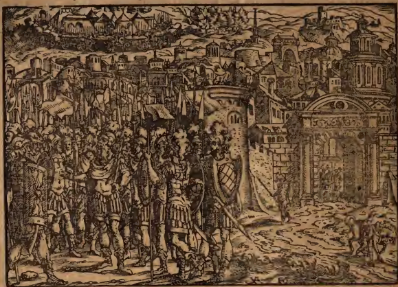
Castriotus mouet signa in hostem.

magno silentio saltus quosdam, & valles vicinas impleuit armatis, ut me- dios occluderet, & improvisos eis exciperet insidijs, si sibi res gesta fuisset, & collata (ut putabat) signa. Mansum in ea inani expectatione duobus