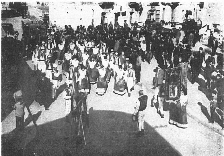
Il Gruppo Folkloristico di S. Sofia d'Epiro per le vie di Corigliano-Scalo.