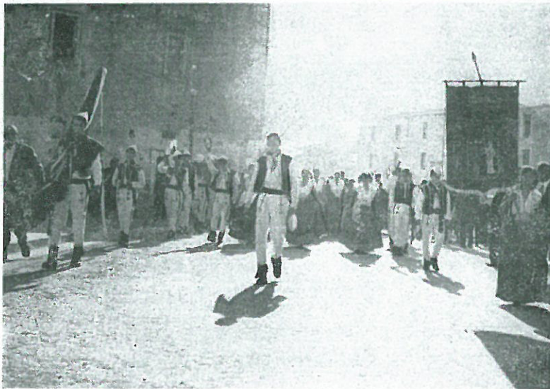
Il Gruppo Folkloristico di S. Sofia d'Epiro sfilava per le vie di Corigliano.

13) Mentre le cose modernizzano lui invecchia. Chi? Mindi, il nostro potente suonatore di grancassa. E perché? Salirà al campanile non più sulla ripida scala a