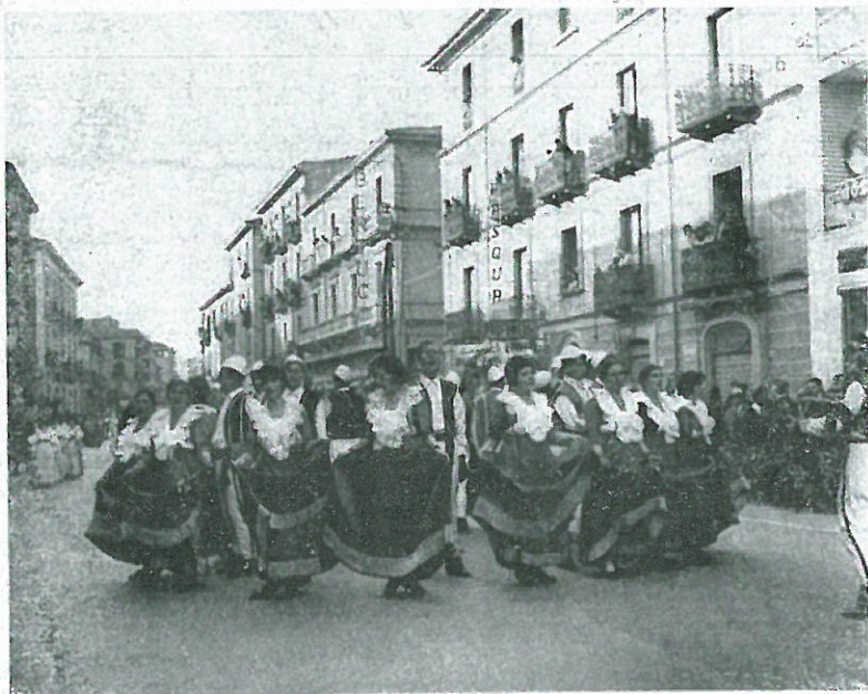
Il Gruppo Folkloristico di S. Sofia d'Epiro int'orno alla Bandiera, Corso Mazzini, a Cosenza.

Quasi dimenticati dall'Autorità, tra stenti e fatiche, consolati dai canti nei quali la nenia orientale sembra mescolarsi a ritmi che ricordano gli Spirituals negri, i Sofioti rinnovarono ogni anno la fratellanza con gli Albanesi limitrofi.