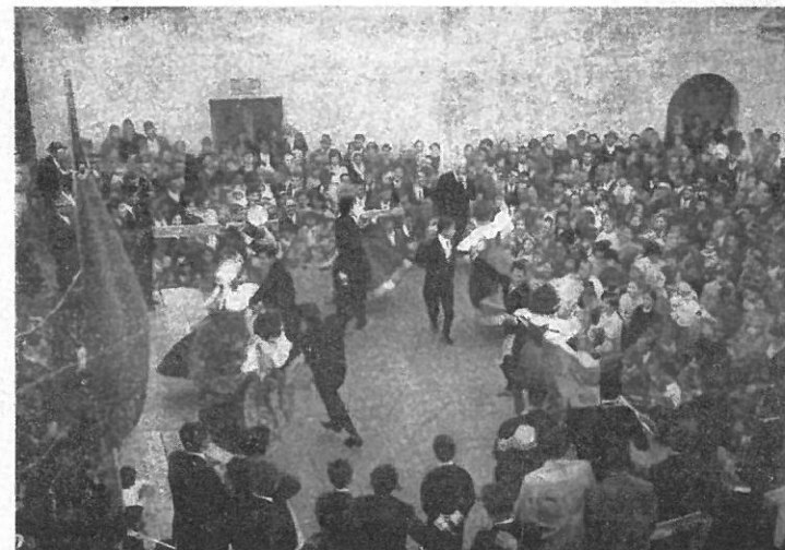
Il Gruppo Folkloristico di Saracena mentre esegue una movimentata danza.