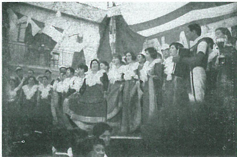
Il Gruppo Folkloristico di S. Sofia d'Epiro a S. Nicola dell'Alto.