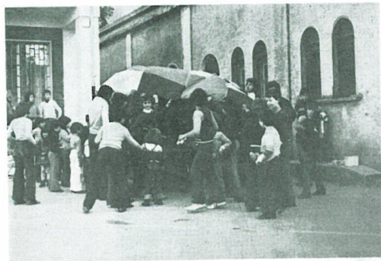
Conto alla rovescia (si sta gonfiando) per Paglionin N. 1.