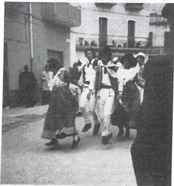
Il gruppo folkloristico Sofiota per le vie di Civita il Martedì di Pasqua