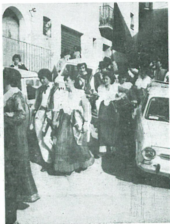
La nostra bella gioventù ka Sheshi Karavonit mentre sfilava.