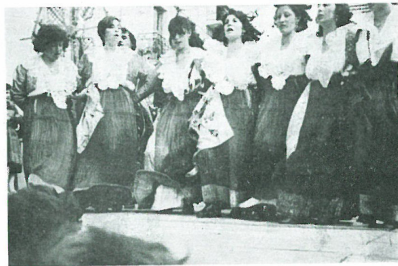
Il nostro gruppo folkloristico mentre canta e danza sul palco per «La Primavera degli Italo-Albanesi».