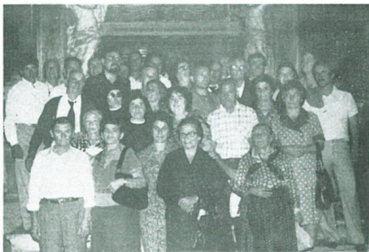
A S. Zaccaria avanti l'Urna contenente le Ossa di S. Atanasio