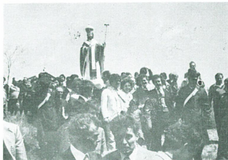
Te Konza