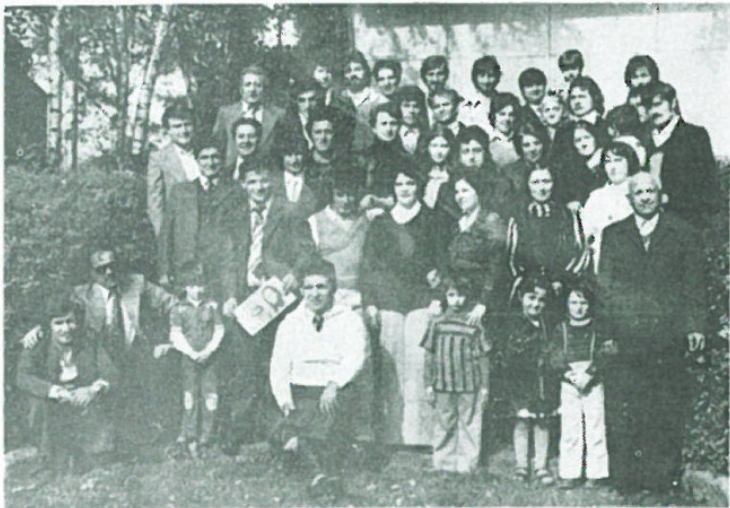
I Sofioti di Werl