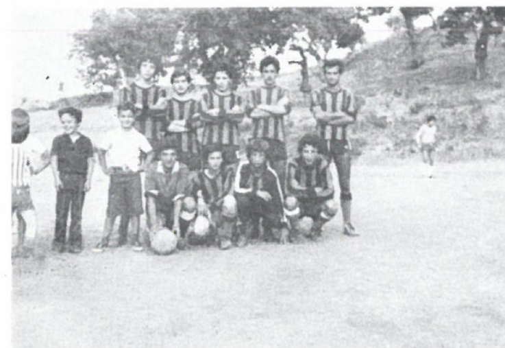
Le speranze del Calcio Sofiota