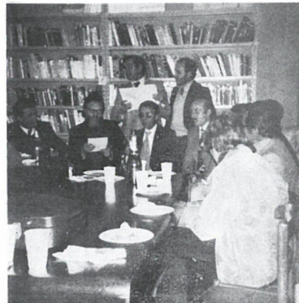
A Genova si canta