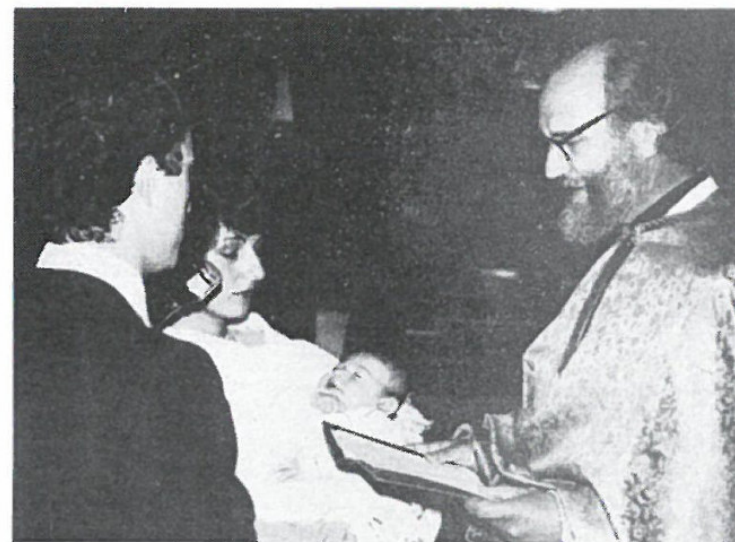
Battesimo del Piccolo Serravalle Rossano