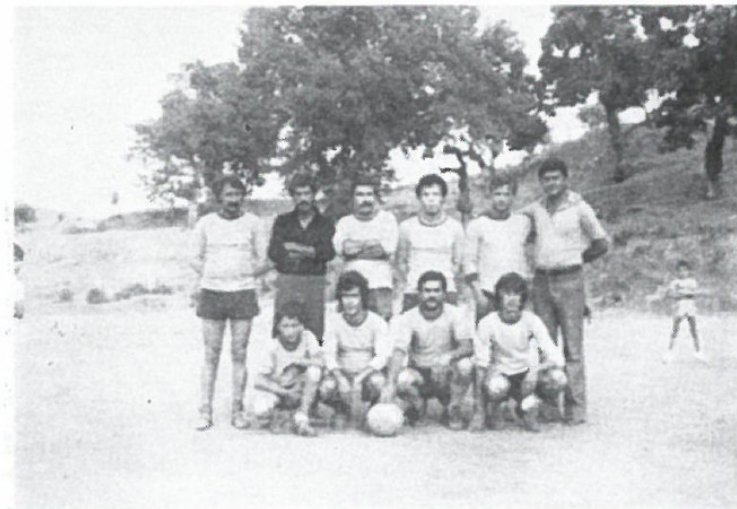
La Squadra dei Vecchi Leoni vincitrice