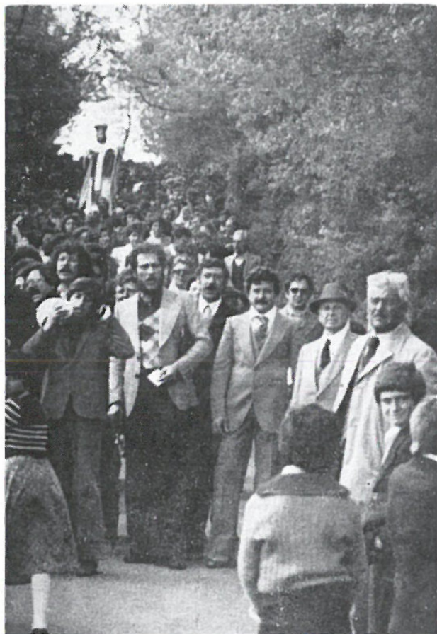
Te Kava Konzes