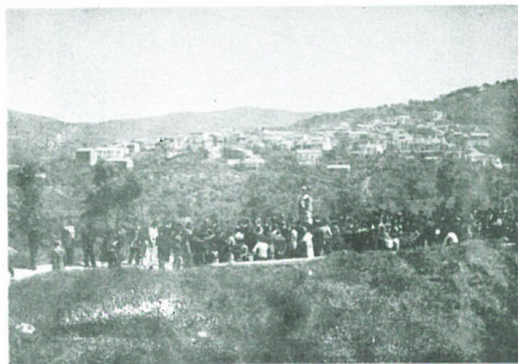
La Procesione di Ritorno Ka Konza