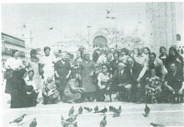
I Sofioti in Piazza S. Marco a Venezia