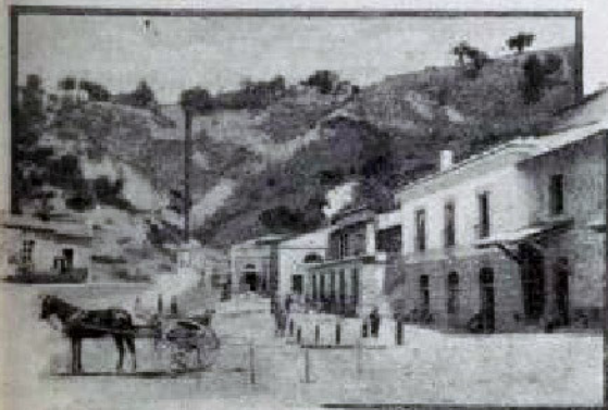
SALINA DI LUNGRO.

* Ei non la libera, nè la rilascia, — perchè bramala per sè. »