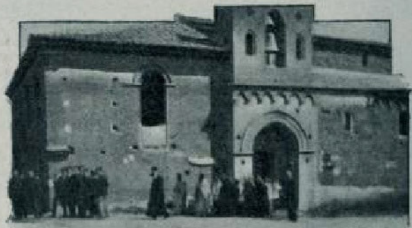
COLLEGIO ITALO-ALBANESE IN SAN DEMETRIO CORONE.

Lingua. — Il dialetto parlato dagli Albanesi d'Italia appartiene al tipo tosco , cioè albanese del sud, detto così per distinguerlo dal ghego , od albanese del nord. Esso, secondo il Bopp ed altri filologi, s'avvicina di molto al