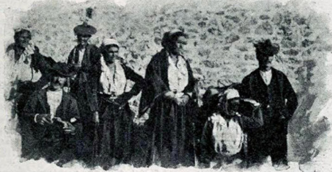
TIPI ALBANESE DI PLATICI.

Nella Calabria Citra: San Demetrio con la fraz. Macchia, San Cosmo, San Giorgio, Spezzano, Vaccarizzo.