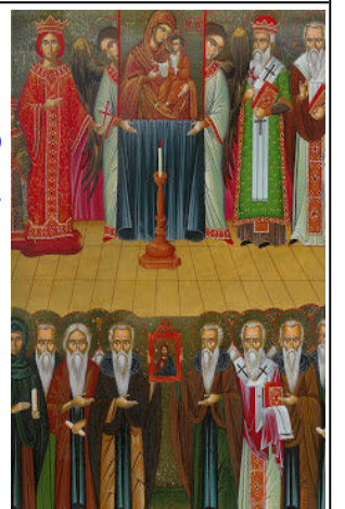
Icona del Trionfo dell' Ortodossia

I Domenica di Quaresima—dell'Ortodossia L'icona della festa rappresenta la grande processione della "vera fede" svoltasi l' 11 marzo 843 dalla chiesa delle Blacherne a Santa Sofia, con l'ostensione e la venerazione delle icone, dopo la vittoria sugli eretici e le lotte iconoclaste. Al centro della raffigurazione ci sono due chierici che sorreggono l' Odigitria , la veneratissima icona del monastero di Odegon palladio della Città. A sinistra è raffigurata l'imperatrice Teodora. A destra vi è il patriarca Metodio. Nell'icona è raffigurato anche il patriarca Tarasio sulla cui richiesta l'imperatrice Irene, nel 787, aveva convocato il Concilio di Nicea in cui si era avuto la prima condanna—dell'eresia.